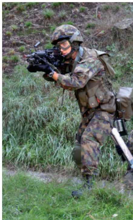
Aus der Deckung hervor.

Beim heutigen Grenadier ist ein Gleichgewicht zwischen Sozialkompetenz, intellektueller Kompetenz und physischer