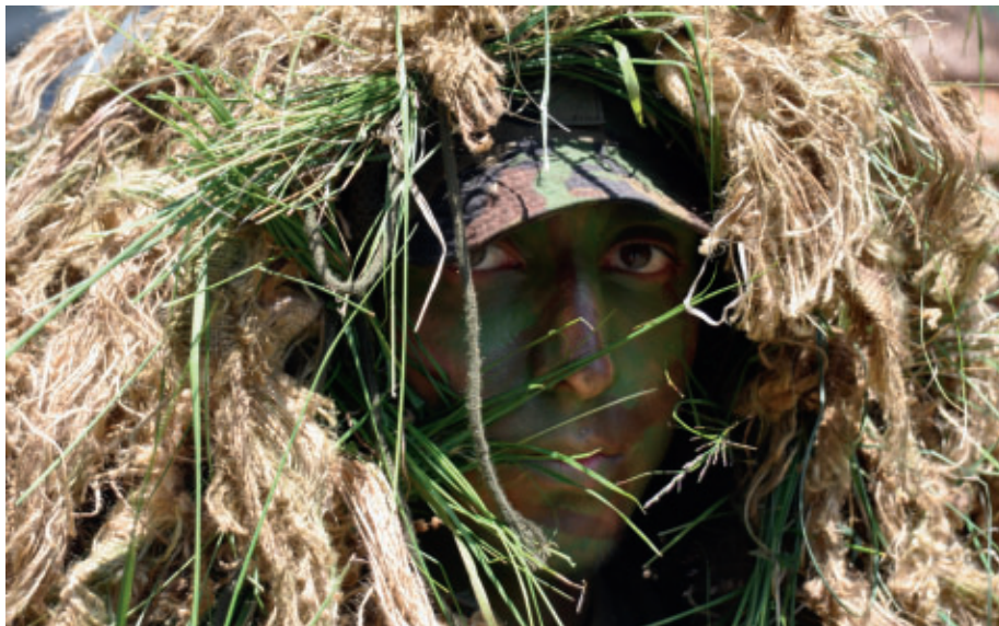
Gut getarnter Scharfschütze. Die Scharfschützen werden immer wichtiger.

Er ist ein absoluter Spezialist und kennt alle Einsatzmöglichkeiten der entsprechenden Waffen und der damit verbundenen Tarnung der Schützen, die hier eine enorm wichtige Rolle spielt. Es geht darum,