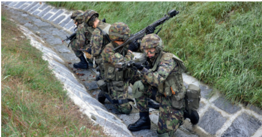
Fortgeschrittener Häuser- und Ortskampf stellt hohe Anforderungen an die Grenadiere. Eine Gruppe steht in Deckung bereit.

Fehr: Ich hatte die Idee schon vor dem Eintritt in die RS im Kopf, wollte mich aber zuerst mal umsehen. Es hat sich aber schnell bestätigt, dass ich hier gerne die Offizierschule absolvieren möchte.